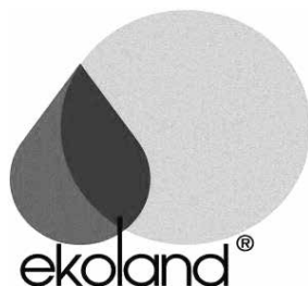
Rys. 1. Znak Ekoland nadawany na polskie, ekologiczne produkty rolne

Systematycznemu rozwojowi rolnictwa ekologicznego w Polsce towarzyszy rozwój przetwórci ekologicznych. W okresie 2004–2013 liczba tego typu jednostek produkcyjnych wzrosła w Polsce ponad osiemnastokrotnie, od 22 w 2003 roku do 407 w 2013 roku. Najwięcej przetwórci ekologicznych było w województwach takich, jak: mazowieckie – 78, wielkopolskie – 53 oraz lubelskie – 45. Łączna liczba przetwórci z wymienionych województw stanowiła 43, 2 procent ogólnej liczby przetwórci ekologicznych w Polsce.